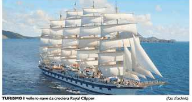
TURISMO Il veliero-nave da crociera Royal Clipper

«-MIO- IL GOLFO di Lerici è entrato nel prestigioso circuito della Royal Clipper l'imponente veliero-veloce da crociera, a 5 alberi e 42 vele. Finito al mondo di tali dimensioni, soprano al leggendario Pressman, la goletta considerata la più grande e veloce in circolazione. Dopo la sosta del 7 maggio scorso la Royal, lunga 134 metri e con una capacità di 228 passeggeri, approderà a Lerici ancora altre 5 volte nel corso nei prossimi mesi, tra luglio e ottobre. Si inizia do-